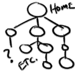
Borrador de un ordinograma Fuente